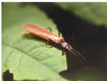
カミムラカワゲラ